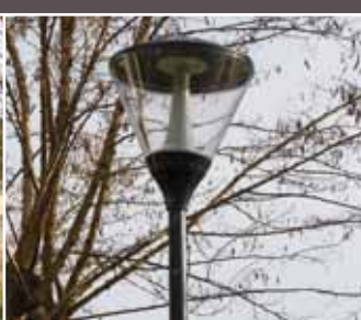
> Autres travaux : Le nouvel éclairage du Chemin rural du Grand Veneur

Afin d'améliorer et de sécuriser la circulation des piétons, à la nuit tombée, 14 nouveaux candélabres ont été installés sur le chemin rural du Grand Veneur (5 sur la première section entre la rue de l'Ermitage et la rue Jean de La Fontaine, 9 sur la seconde section entre la rue Jean de La Fontaine et la rue François Villon). À noter que l'intensité lumineuse de ces candélabres sera réduite dans les prochains jours pour limiter la gêne de certains riverains.