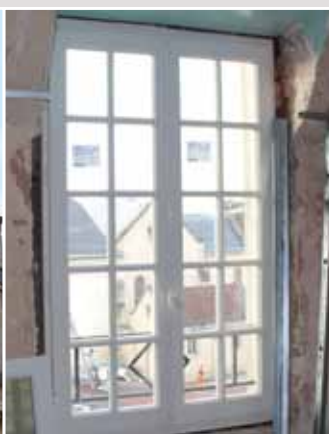
> Rénovation complète du Château des Chenevières - Rénovation des planchers, - Remplacement des menuiseries.