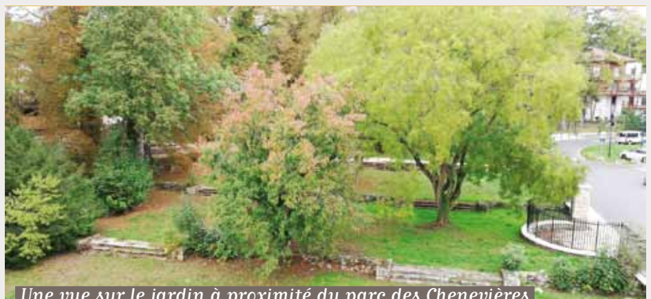
Une vue sur le jardin à proximité du parc des Chenevières