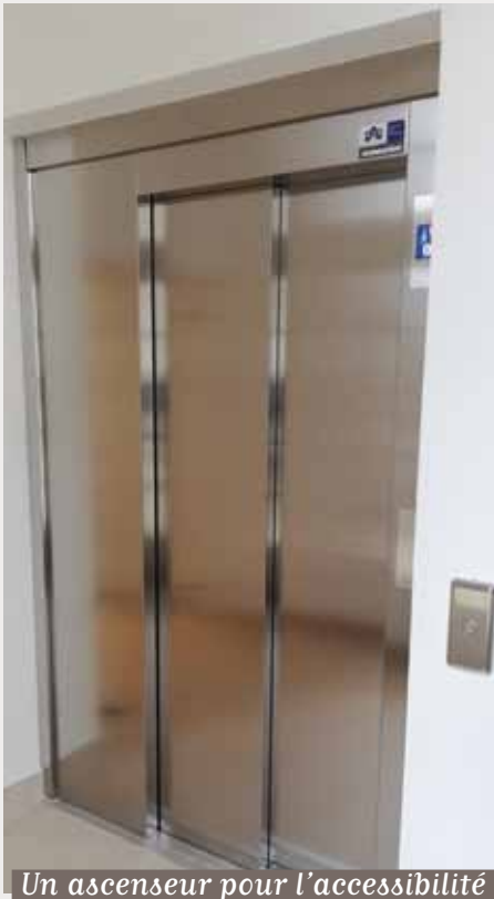
Un ascenseur pour l'accessibilité