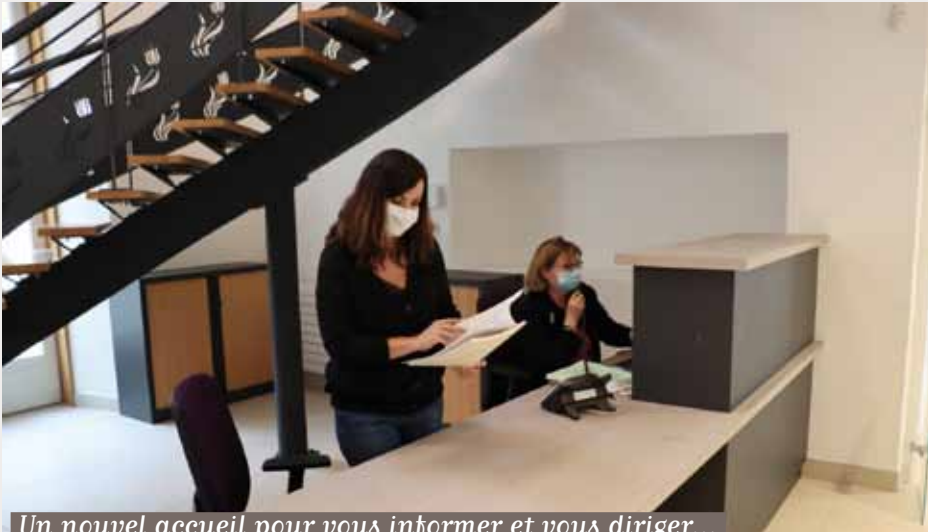
Un nouvel accueil pour vous informer et vous diriger...