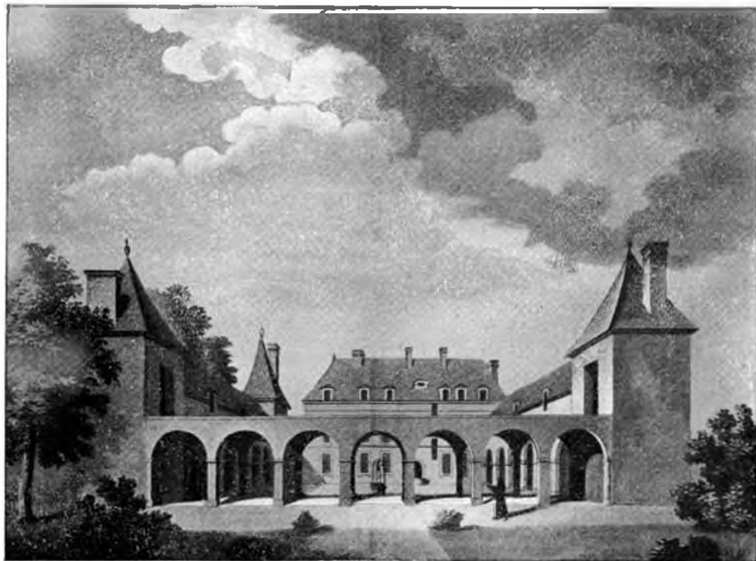
VUE DU CHÂTEAU DE VIGNAY, HABITATION DU CHANCELIER L'HOSPITAL.